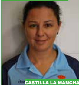
CASTILLA LA MANCHA