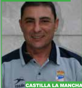
CASTILLA LA MANCHA