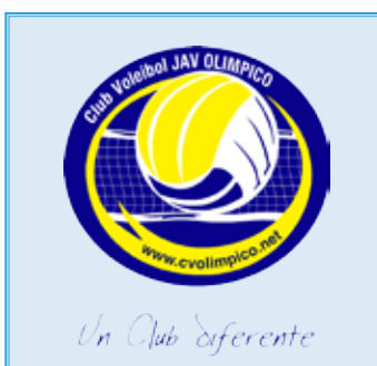
LAURA CASTELEIRO 12 15/01/1999 - Receptora - 1,75 m. 🇪🇸