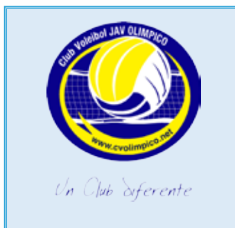
BEA HERRERA 4 18/12/1998 - Libero - 1,66 m. 🇪🇸