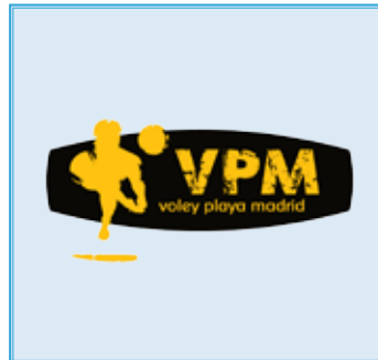
CARMEN MUÑOZ 3 16/07/1990 - Opuesta - 1,80 m. 🇪🇸