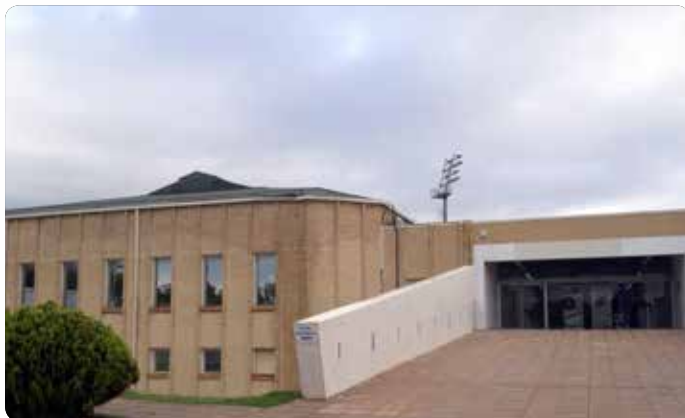
PABELLÓN L'HOSPITALET NORD