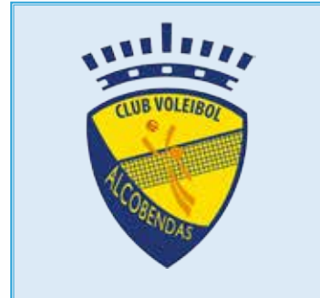
ADRIANA ALONSO 9 17/04/2000 - Receptora - 1,70 m. 🇪🇸