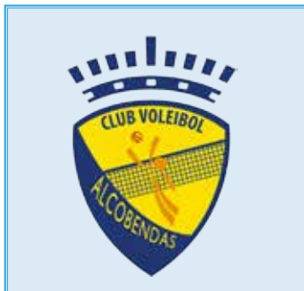
ANA CORREDOYRA 6 30/04/1997 - Libero - 1,68 m. 🇪🇸