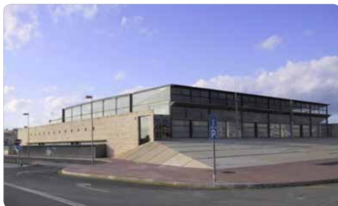
POLIESPORTIU MUNICIPAL DE CIUTADELLA 2500 ESP.